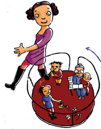
Vielfalt der Zwecke

6. Eine Bürgerstiftung wirkt in einem breiten Spektrum des städtischen oder regionalen Lebens, dessen Förderung für sie im Vordergrund steht. Ihr Stiftungszweck ist daher breit. Er umfasst in der Regel den kulturellen Sektor, Jugend und Soziales, das Bildungswesen, Natur und Umwelt und den Denkmalschutz. Sie ist fördernd und/oder operativ tätig und sollte innovativ tätig sein.