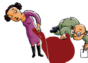
Transparenz und Kontrolle

10. Die interne Arbeit einer Bürgerstiftung ist durch Partizipation und Transparenz geprägt. Eine Bürgerstiftung hat mehrere Gremien (Vorstand und Kontrollorgan), in denen Bürger für Bürger ausführende und kontrollierende Funktionen innehaben.